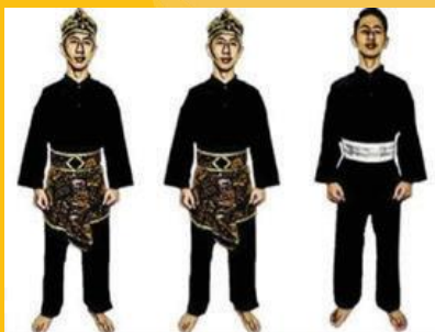
ATLET TGR PUTRA