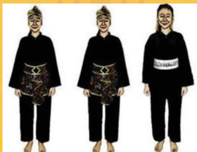
ATLET TGR PUTRI