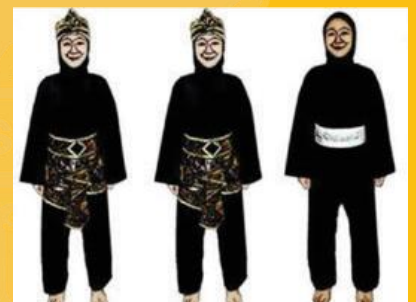
ATLET TGR PUTRI BERTHIJAB